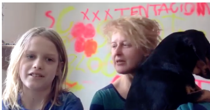
2020. gada aprīlis

RZ: - Kāda bija sadarbība ar citiem aktieriem?